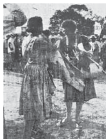
外国代表に花束を手交

第8回原水爆禁止世界大会にむけて、歩き続けている「国民平和大行進」は、7月26日府下のトップをきつて和歌山コースが大坂入りしました。27日には京都、奈良、兵庫から5コースが大坂入りをし、28日には西淀川コースが出発をしました。府内7コースには延べ6万人が参加しました。また、28日には東京からかけた4人の外国代表も参加しました。28日夕刻から中之島公園に結集した行進は、参加者2千人の「関西歓迎集会」が開かれました。