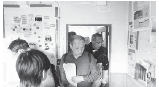
「空襲の生き証人」 英彰小学校階段室