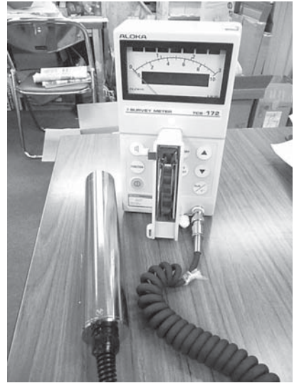
▲当会所有の放射線測定器 積極的にご活用ください

大の関心事は、「放射線の人体への影響」であろうと思われる。農業等を営み、その地で子や孫と暮らしていく方々にとっては極めて切実な情報にも関わらず、これが、分りやすく説明されていない(できない)事に苛立ちや、歯がゆさ、限界を感じている住民、行政関係者、研究者等の方は多いのではないのでしょうか。「一体、何シールベルトまでなら被ばくして良いのか?」これに対して「一〇〇ミリシーベルト以下は・・・」このようなやり取りが、延々と行われてきたと思えます。説明する側も、される側も、もう一つ納得し