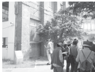
峠三吉詩碑の英語文 (裏面)

せてくれた弟、僕の宝ものとして見せてくれた小箱北中の記章名札メダル綿をしきつめて丁寧に並べた、戻らぬ人と知りながらももしも居てくれればとせんなき思ひを走らせる」とあり、涙なしには読むことができませぬ。