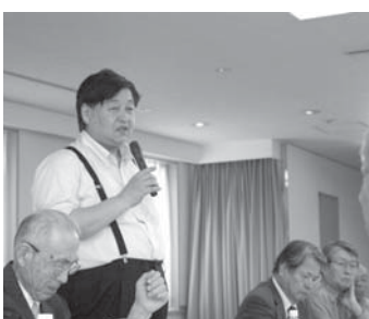
このたびの東京で非核の政府を求める会の全国総会が開催されました。

この一年の物語者のご冥福を祈っての黙とうに始まり、昨年のNPT再検討会議をはじめとする核兵器廃絶の運動の前進を踏まえて、核兵器禁止条約に向けた運動を強めることなどの本年度の運動方針が討議されました。